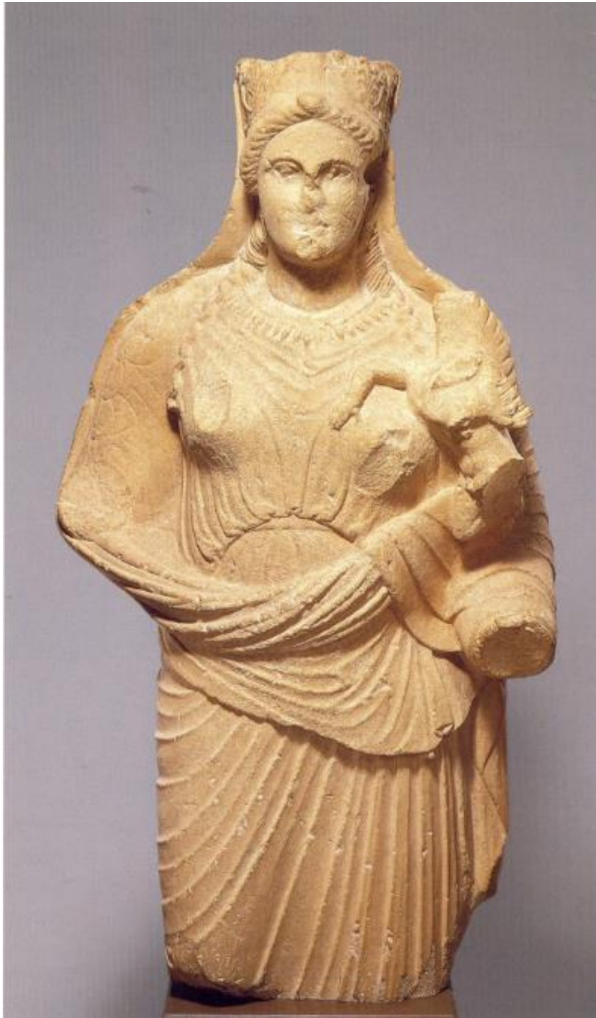
Αφροδίτη με περίτεχνο στέμμα, χιτώνα και μανδύα και με πτερωτό έρωτα στο αριστερό χέρι Ασβεστολιθικό άγαλμα από τους Γόλγους (περ. 330-320 π.Χ.)