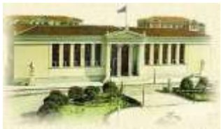
ΕΘΝΙΚΟ ΚΑΙ ΚΑΠΟΔΙΣΤΡΙΑΚΟ ΠΑΝΕΠΙΣΤΗΜΙΟ ΑΘΗΝΩΝ Πανεπιστημίου 30, 106 79 Αθήνα

4rd INTERNATIONAL CONGRESS OF KARPATHIAN FOLKLORE